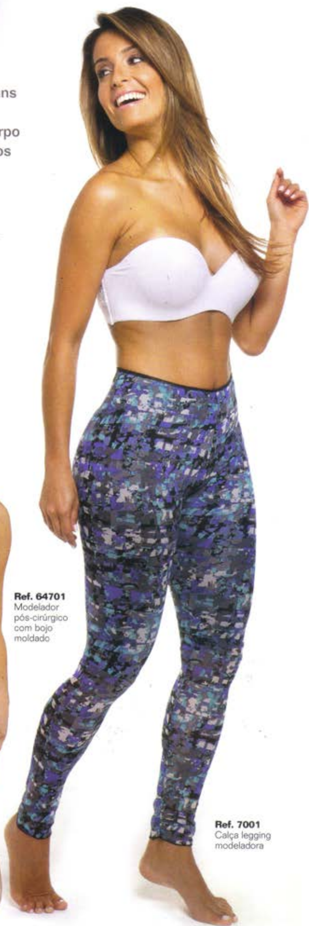
Ref. 7001 Calça legging modeladora