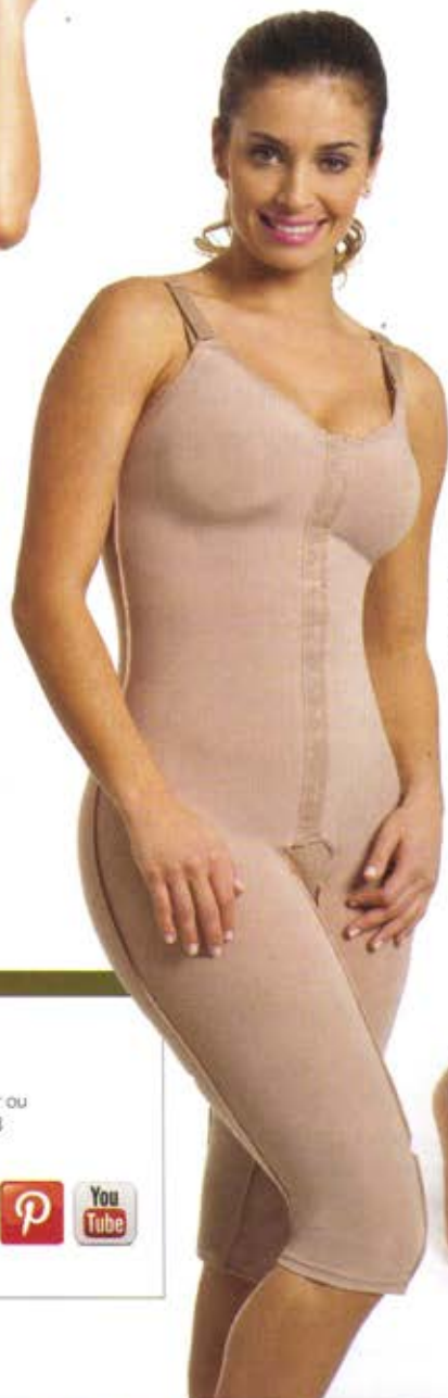
Ref. 64701 Modelador pós-cirúrgico com bojo moldado