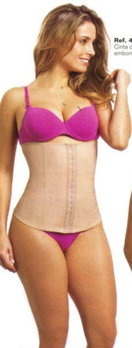
Ref. 404 Cinta cotton emborrachada

Presente nas malhas compressivas e em alguns modeladores Esbelt, o fio emana® possui cristais bioativos que absorvem o calor do corpo humano e o devolve como raios infravermelhos longos que penetram na pele estimulando a microcirculação e o metabolismo celular